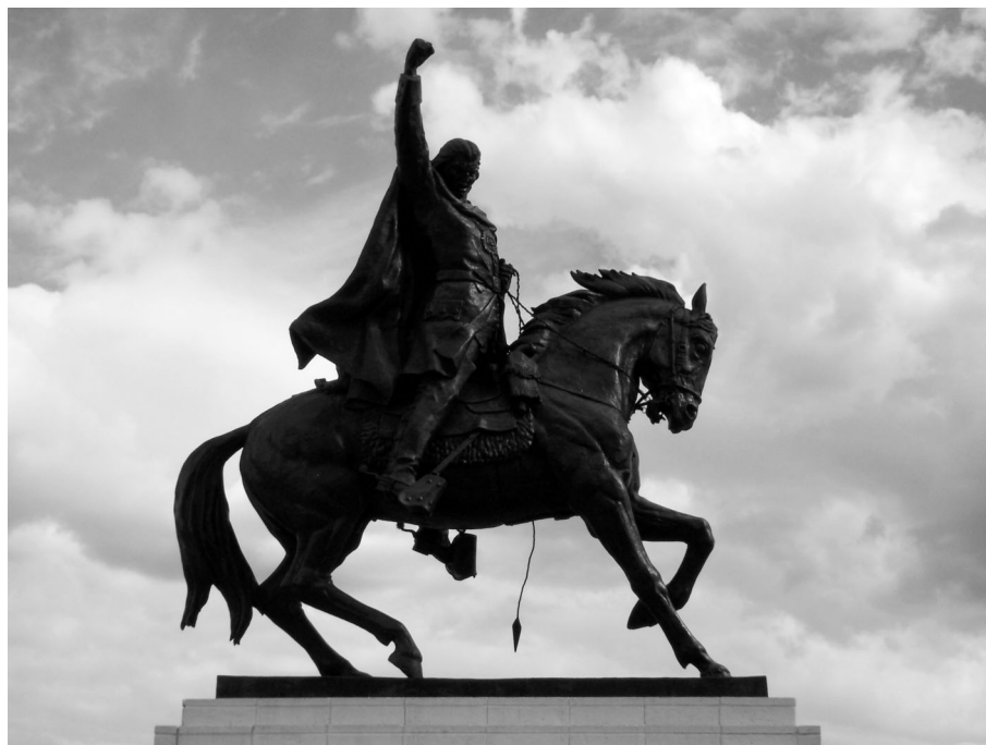
5. Joaquín Ugarte y Ugarte. Monumento a Túpac Amaru, 1980. Cusco.

La escultura (fig. 5), fundida en 1976, recién es inaugurada en Tungasuca, Cusco, en noviembre de 1980 luego de superar una serie de inconvenientes que cuestionaban su emplazamiento en la Plaza de Armas de la ciudad de Cusco. Ahora la anécdota se revertía; era el Presidente Belaúnde, en su segundo gobierno, 13 años después del golpe militar que lo había derrotado de su primera gestión, quien inauguraba un monumento ideado durante la gestión de Velasco Alvarado, su "enemigo político". De esta manera Belaúnde también reconoce la valía de dicho icono que