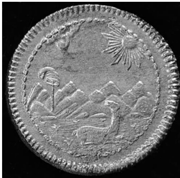
1. Moneda de un octavo de peso, 1823. Cobre. Lima.

papel sobrante colonial. Para 1825 en numismática circula otra alegoría, la de la Libertad en una imagen femenina de pie, esta vez con gorro frigio, vestida a la usanza romana con subpanum 2 y túnica, inspirada en Marianne, la muchacha símbolo de la República Francesa, figura vigente en monedas y billetes hasta 1897.