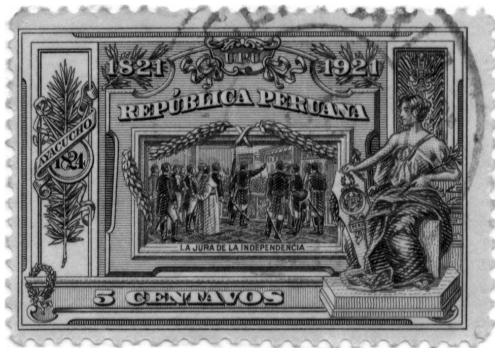
3. Estampilla por el centenario de la Independencia, 1921.

Este homenaje se refleja también en la numismática al emitir una serie de estampillas donde, en cuatro de ellas, se resalta la imagen del general San Martín. De ellas, sin lugar a dudas, la más importante es aquella que reproduce el cuadro Proclamación de la Independencia 11 de Juan Lepiani (fig. 3) cuya composición, inspirada en el cuadro Ecce Homo del italiano Antonio Ciseri, se desarrolla en dos espacios: el balcón, ambiente en cierta medida cerrado en el cual se encuentran las autoridades principales junto a San Martín, jugando el papel de emisor, algunas de ellas destacadas con el rojo que los empuja ópticamente hacia