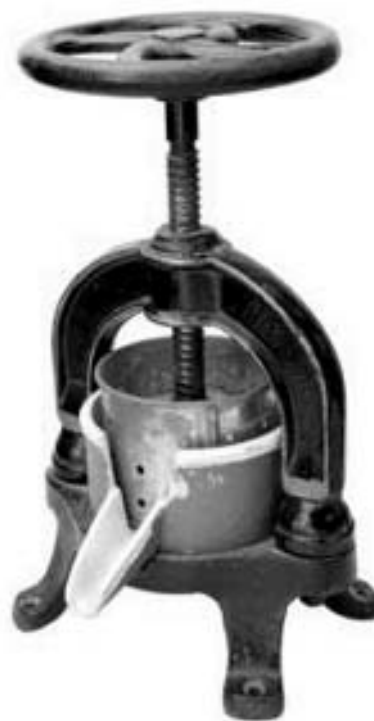
Prensa utilizada en prácticas de Agricultura. Instituto-Escuela. Sección Retiro.