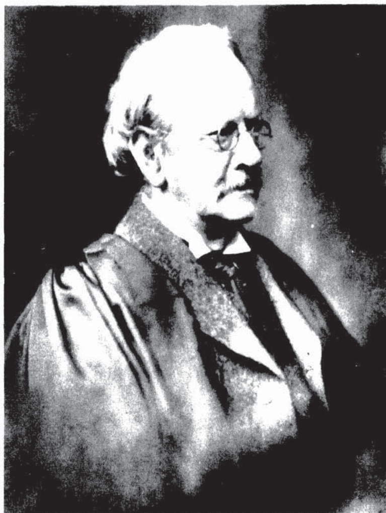
J. J. Thomson (1856-1940).