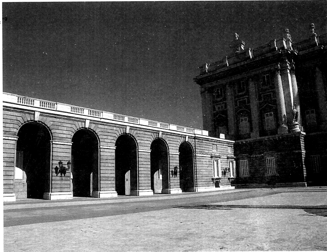
Exterior del archivo. Fachada del Palacio Real: arcos nuevos con la entrada al Archivo